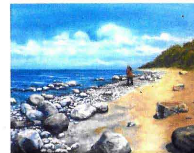
Ostsee bei Rerik